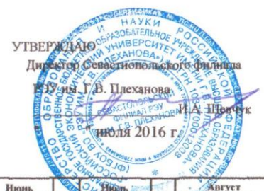
График учебного процесса

Севастопольский филиал РЭУ им. Г.В. Плеханова